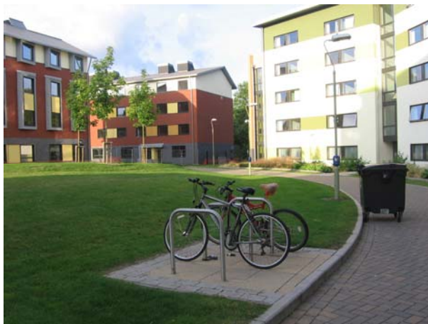
Общежитие кампуса Белых Рыцарей

сформулировал свой закон Роберт Бойль. Четыре дня в Лондоне были также незабываемыми. Особенно меня потряс зоопарк и Тауэр.