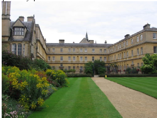
Trinity College, Oxford