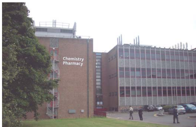
Здание химического факультета