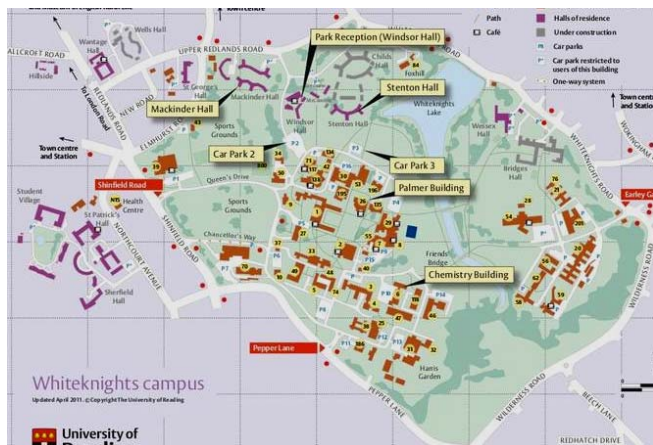
Карта-схема кампуса Белых Рыцарей

В мировом рейтинге университет Рединга занимает 145 место и обучение в нем дорогое – около 9 тыс. фунтов в год. Однако студенты полагают, что это хорошая инвестиция в будущее. Повсюду в кампусе встречаются китайские студенты и, что удивительно, дети из России (хотелось бы и мне провести каникулы подобным образом !). Скажу еще о том, что так называемое общежитие для студентов, в котором размещались участники конференции, не уступает по комфорту 3-звездочной гостинице.