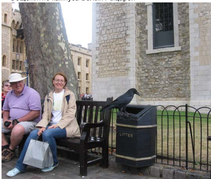
Один из знаменитых воронов Тауэра не прочь покопаться в мусорном ящике, пока Ravens' Master фотографируется с посетителями